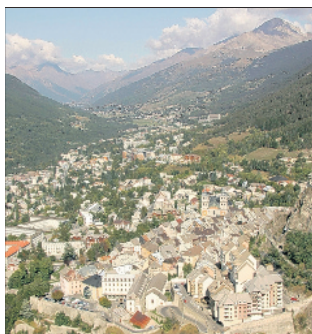
À 90 kilomètres de Gap, la ville de Briançon revendique sa spécificité montagnarde.