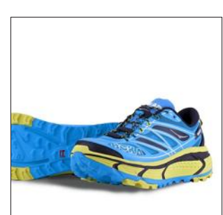
La Mafate speed DR