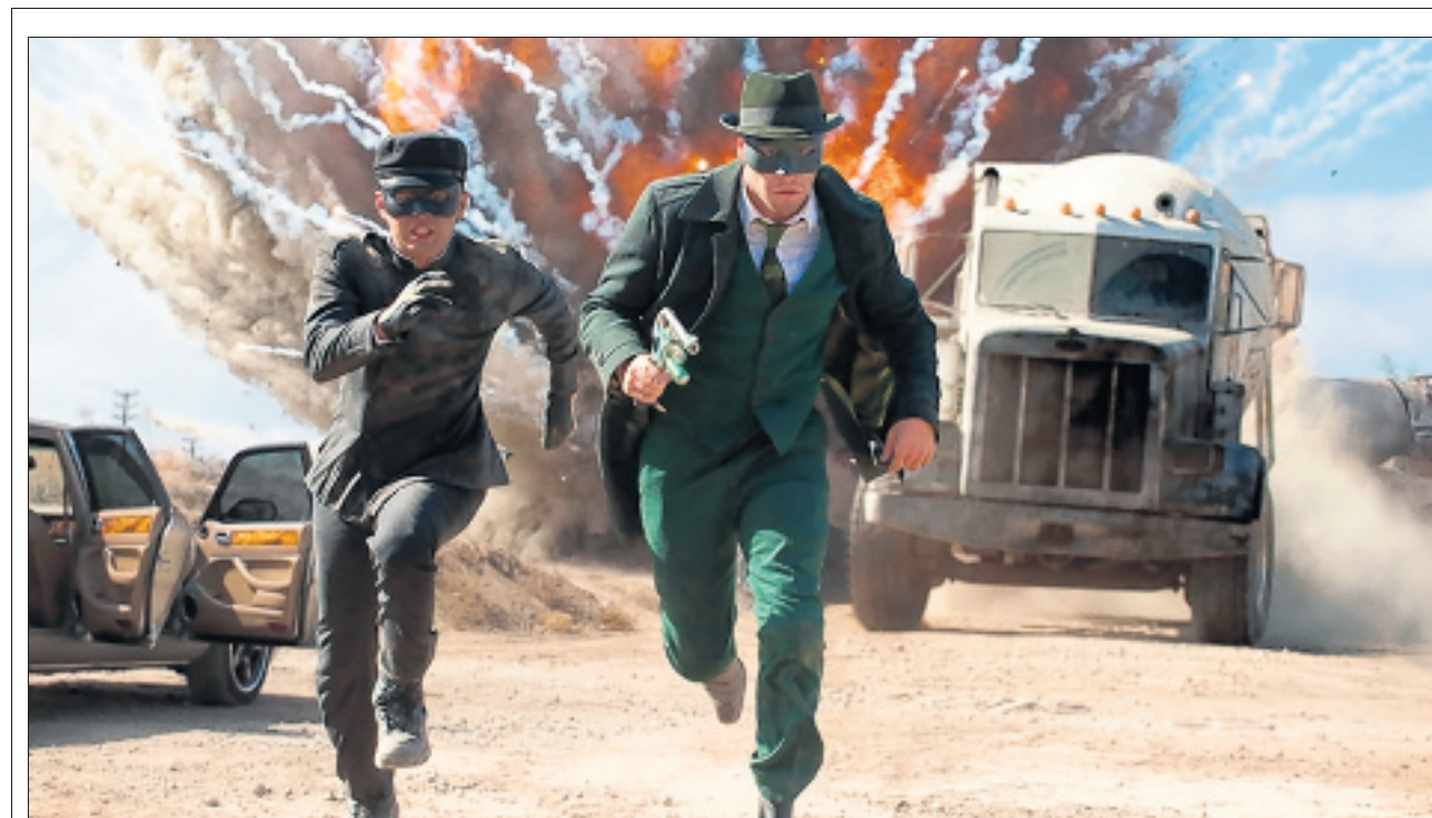
THE GREEN HORNET. De Michel Gondry, avec Seth Rogen, Jay Chou, Christopher Waltz et Cameron Diaz – E.-U., 1 h 57. Un joyeux fétard, héritant d'un empire de presse à la mort de son père, se transforme avec un partenaire plein de ressources, en super-héros pour débarrasser Los Angeles de sa pègre. Un cocktail explosif, inventif et réussi de fantaisie ludique et d'effets spéciaux à grand spectacle. À voir à La Joue-du-Loup, Pra Loup et SuperDévoluy.